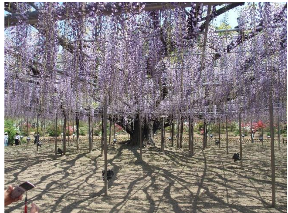
世界一の美しさを誇る大藤