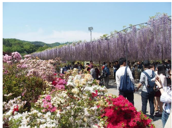
ツツジとのコントラストが美しい大長藤