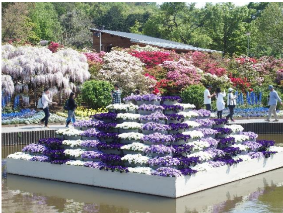
水上花壇とグルメツツジと藤の路