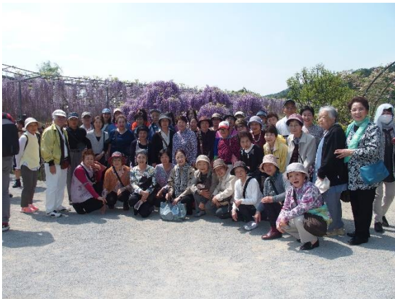
大藤棚の前で後援会の皆様と

昼食は、いちごの里のbuffet・レストラン「いちご一会」で地元産食材を使用したイタリアン中心の料理、スイーツなど(約 60 種)を愉しみました。途中、栃木県最大級の「道の駅どまんなか・たぬま」では地元の野菜などの買い物を、帰路は「佐野プレミアム・アウトレット」に立ち寄り、ショッピングを楽しみました。