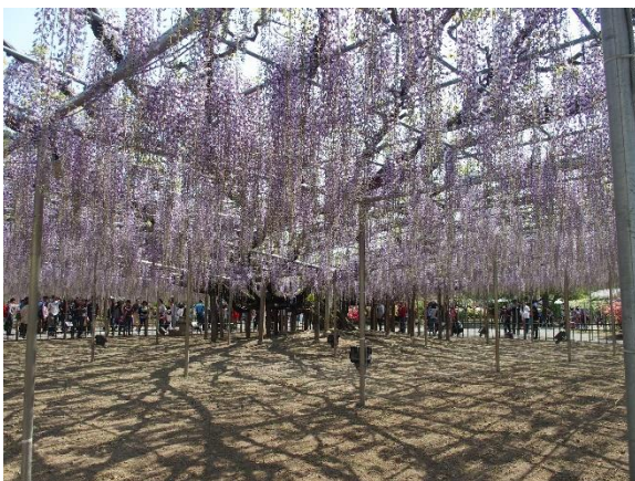
大藤は 7 分～8 分咲でした