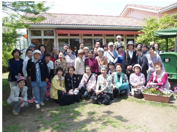
buffe・レストラン「いちご会」にて