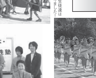
※15 ハイレベルなチア・リーディング部の皆さん