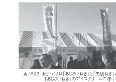
※23 松戸からは「あじさいねぎ」と「矢切ねぎ」が参加。「あじさいねぎ」のアイスクリームの味は微妙!?