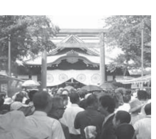
※7 英霊に感謝の放鳩式