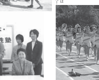
※15 ハイレベルなチア・リーディング部の皆さん