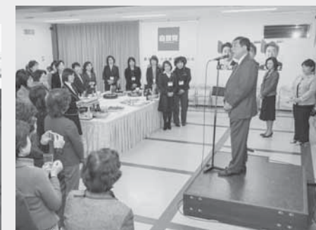
懇親会(自民党本部)

この様な仕事と子育ての両立を目指す取り組みは誠に羨ましい限りであり、利用者たる自衛官と子どもがしっかり守られていると強く印象に残った次第です。また、視察当日、保育所の子ども達は伸び伸びと楽しそうに過ごしており、微笑ましい光景も目の当たりにすることができました。