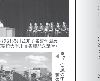
※17 寒風の中、生徒達は頑張りました!