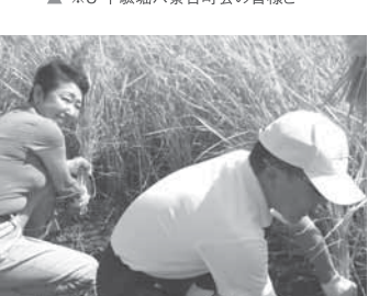
※9 生涯初の稲刈りです