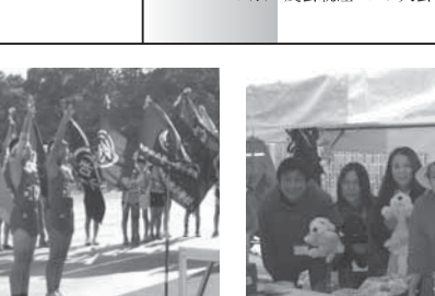
※13 雨天の中での活動でした松戸駅西口