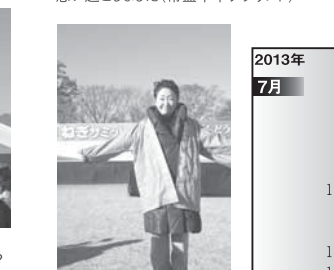
※23 半被を着て応援してきました