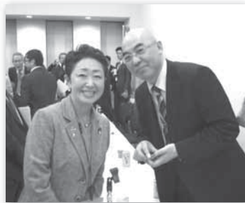
「永遠の0」が大ヒット! ベストセラー作家・百田尚樹さんと