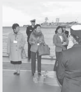
護衛艦「てるづき」のブリッジにて