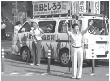
※1 祝当選！皆様の応援に感謝！(八柱駅前交差点)