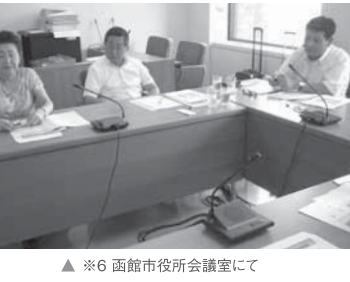
※6 函館市役所会議室にて