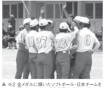
※2 全メダルに輝いたソフトボール・日本チームを思い出しました(常盤平中グラウンド)