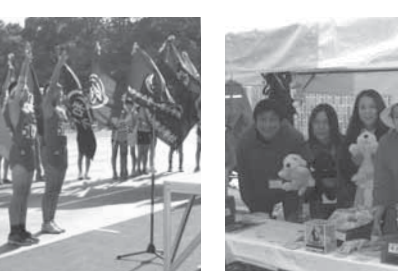
※13 雨天の中での活動でした松戸駅西口