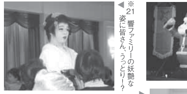
※21 響ファミリーの妖艶なパフォーマンスに皆さん、うっとり♪