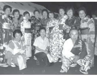
※8 千駄堀八景台町会の皆様と