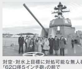
対空・対水上目標に対処可能な無人砲「62口径5インチ砲」の前で