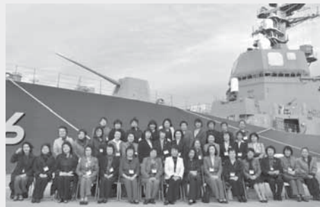
参加メンバーと護衛艦「てるづき」をバックに