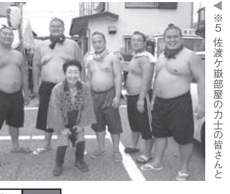
※5 佐渡ヶ部郡屋の力士の皆さんと