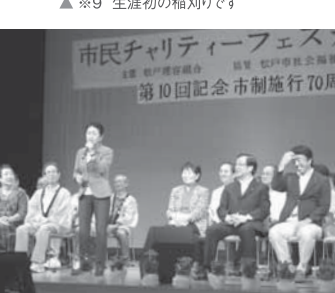
※10 いつもの笑いを交えた挨拶