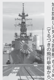
旭日旗越しに見える護衛艦「てるづき」の飛行甲板から

働く女性自衛官が子育てに不安を抱くことなく、何時、何が起るか判らない状況にも対応できる様、0歳から未就学児を対象に365日・24時間の保育態勢が整備され、更には病児・病後児保育、障害児保育対応の他、発病時には敷地内の自衛隊横須賀病院で受診ができます。