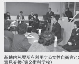
基地内託児所を利用する女性自衛官との意見交換(第2術科学校)