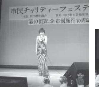
※10 今回は口で歌いました(市民劇場)