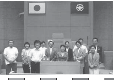
※4 常任委員と共々(深木市議会議場)