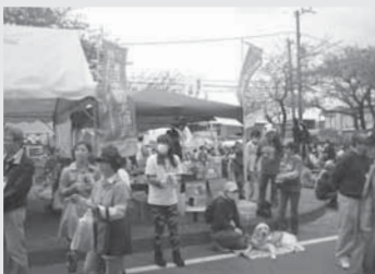
六実桜まつり(平成25年4月)