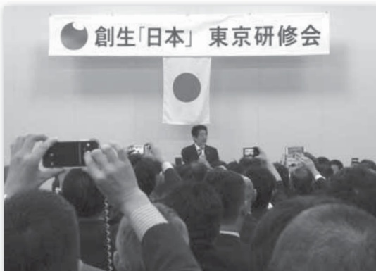
安倍晋三総理登場で最高潮の盛り上がり

※ 創生「日本」は「真・保守主義」の根本理念の下で、夢と希望と誇りをもてる日本の実現に向け結集した国会議員・地方議員の組織です。