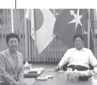
※11 河上茂千葉県議会議長と(議長室)