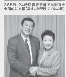
石破 茂 自民党幹事長と