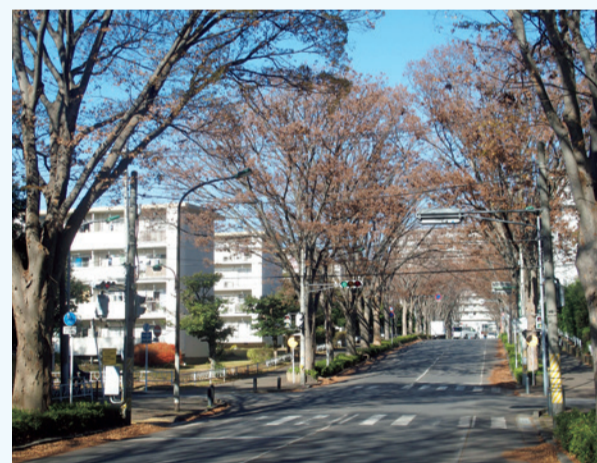
けやき通りから常盤平団地を臨む

(3) 11月に開催された常盤平団地地区意見交換会における課題の1つであった。地域から規制要望が出た際には松戸東警察を通じて千葉県公安委員会へ要請していく。