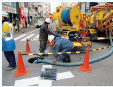
清掃作業の様子

イ. 包括的民間委託はコスト削減等が期待でき、今後も増加する老朽化へ対応する為、業務の効率化・サービスレベルの向上・費用低減などを総合的に勘案し、包括的民間委託を視野に入れた本市に相応しい維持管理手法を検討する。