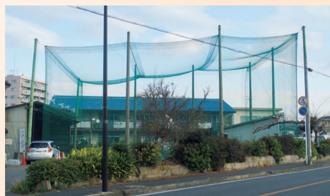
明市民センター移転・新築予定地

●現在地では、敷地面積の関係から新たにエレベーターを建物外に設置できず、また建物内に設置した場合、市民センターとしての機能を大幅に低下させてしまうことから、本市は移転・建替えの方向で検討しておりましたが、昨年9月議会におきまして補正予算が可決され、現在地より約4分、県道沿いにあるバッティングセンター跡地に賃貸借契約により2019年末を目途に新築オープンします。